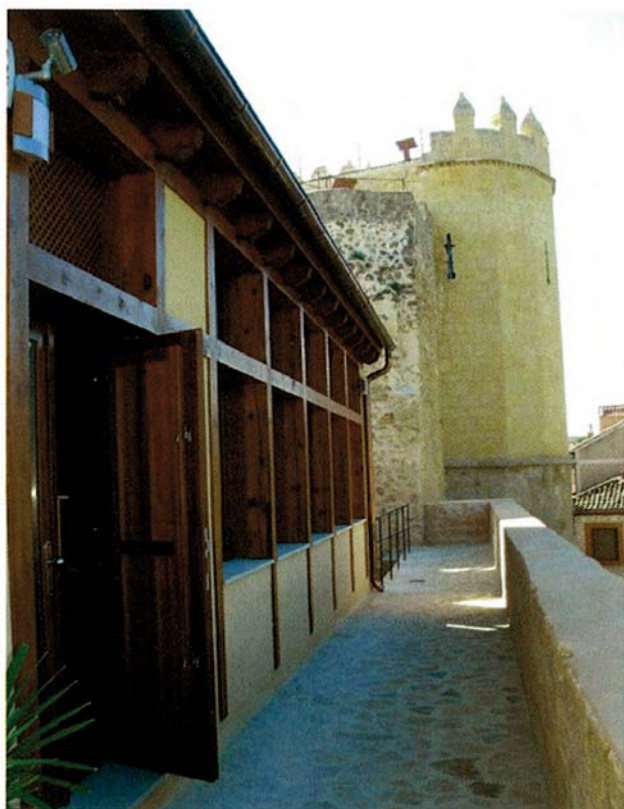
Adarve del punto de información turística con la Puerta de San Andrés al fondo.

La apertura del Punto de Información Turística en la propia muralla culmina todo el proceso de su restauración.