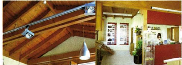
Detalle de la cubierta de madera del edificio y exposición "Segovia, ciudad amurallada" en el punto de información turística.