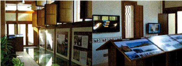
Interior del punto de información turística donde se pueden ver los restos de la muralla a través del pavimento acristalado.

La exposición, que se puede ver a través de dos pantallas táctiles y paneles gráficos, refleja un recorrido por la muralla segoviana y nos brinda la posibilidad de conocer la relación del monumento con la ciudad, no sólo en relación a su función defensiva, sino también a su función comercial y social.